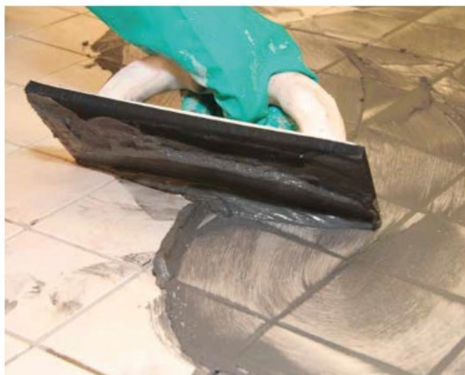
7 Spoinowanie płytek gresowych fugą Sopro DF 10®.