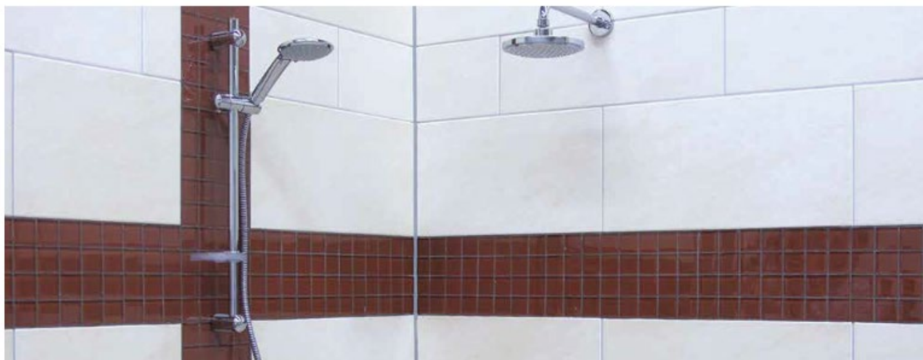
11 Okładzina w łazience zaspoinowana fugą Sopro DF 10®.