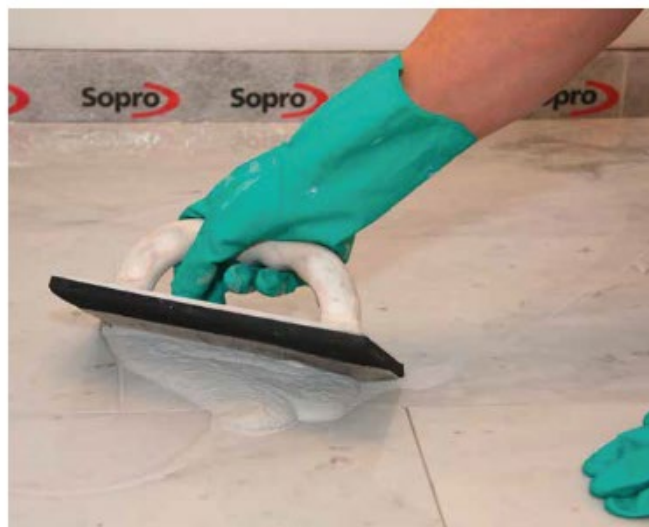
8 Spoinowanie wrażliwego na przebarwienia kamienia naturalnego fugą Sopro DF 10®.