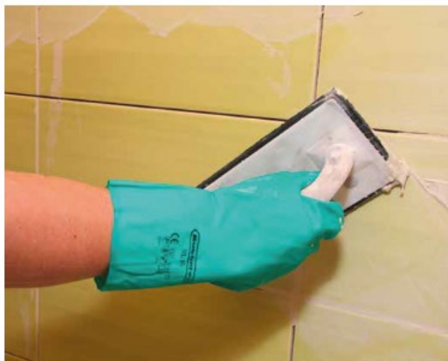
9 Spoinowanie ściennych płytek ceramicznych fugą Sopro DF 10®.