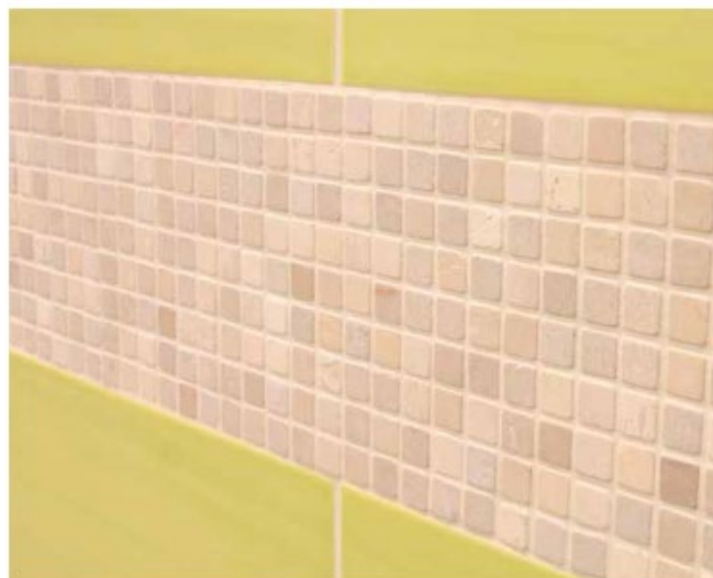
10 Powierzchnie z płytek ceramicznych i mozaiki kamiennej zafugowane fugą Sopro DF 10®.